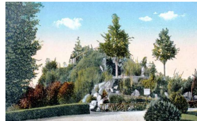
Punkt widokowy z bliska, zdjęcie z ok. 1918 r.