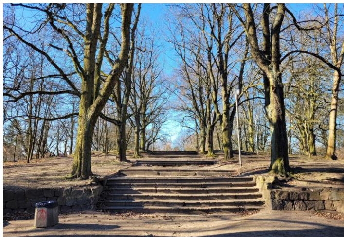
Schody prowadzące na szczyt wzgórza od strony ul. Monte Cassino