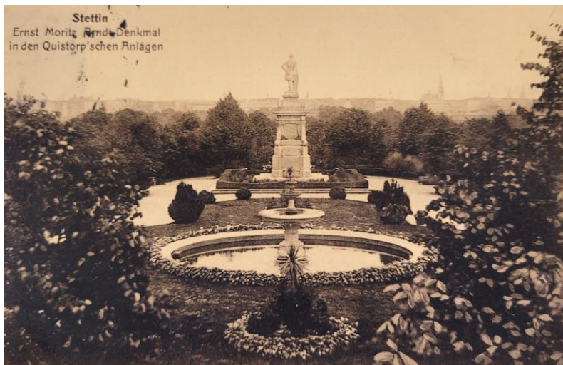
Elegancki skwer na szczycie Wzgórza Arndta w 1896 r. Pocztówka ze zbiorów własnych