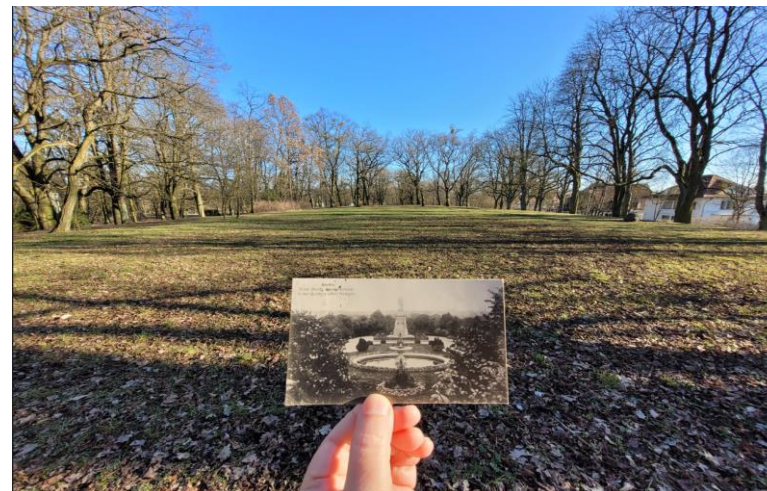
Trawiasty wierzchołek wzgórza – widok w stronę centrum Szczecina