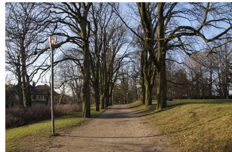
Taras poniżej wierzchołka wzgórza obsadzony kasztanowcami